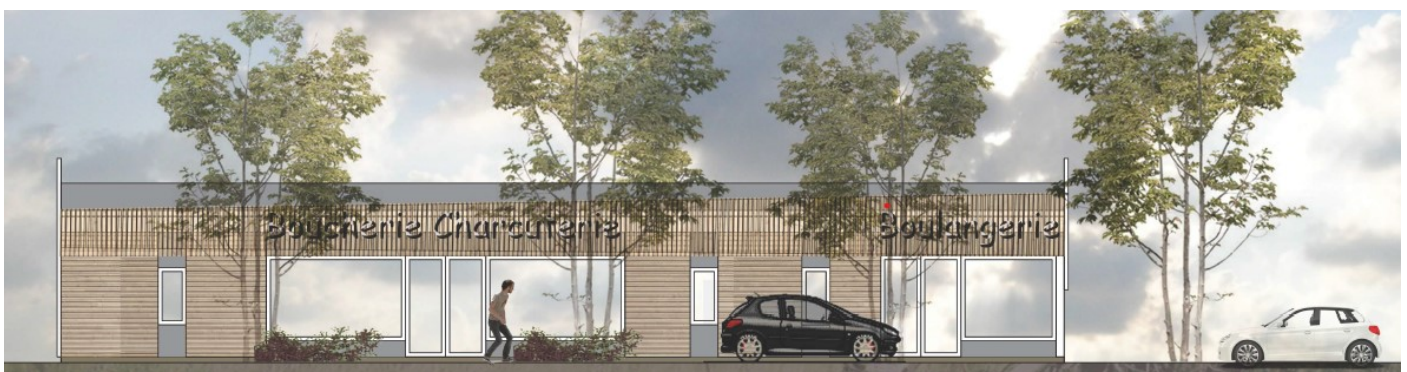
Vue de la rue Beaudichon