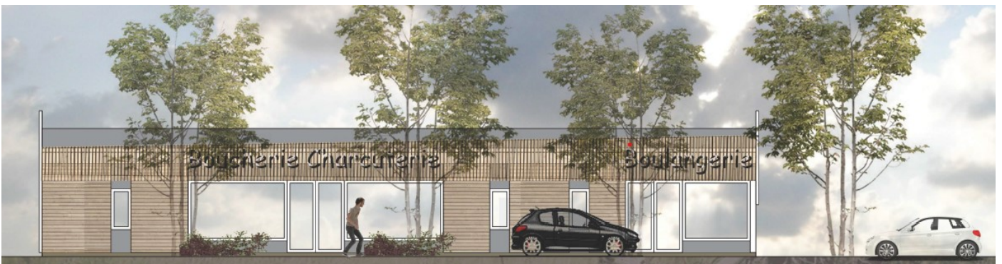
Vue de la rue Baudichon